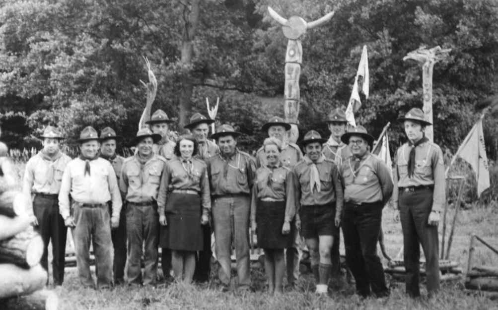
Starší členové a vedoucí tábora Pod Třebelí v roce 1970.

Praha 8, později ČSOP PARAPLE. V letech 1990–1994 byly tábory na louce u brodu přes Jilmový potok, od roku 1995 se tábořilo na ostrově naproti Tabákovému mlýnu (začátkem léta 1995 totiž někdo podpálil táborovou kuchyň s uskladněným materiálem na stavbu stánů). Tábory obvykle začínaly v půlce července a končily první týden v srpnu. Účastnilo se jich zhruba 30 dětí, převážně z Prahy.