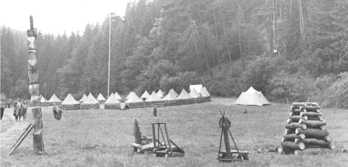
Tábor Pod Třebelí v roce 1970.